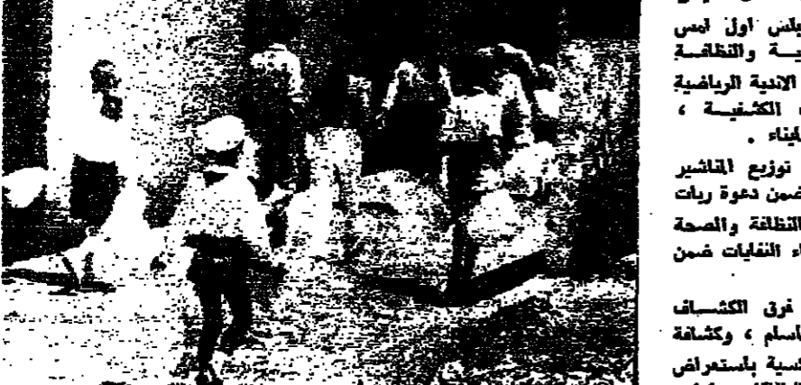
يحلون ايام التفتيات الى حبيبي ان تلقى